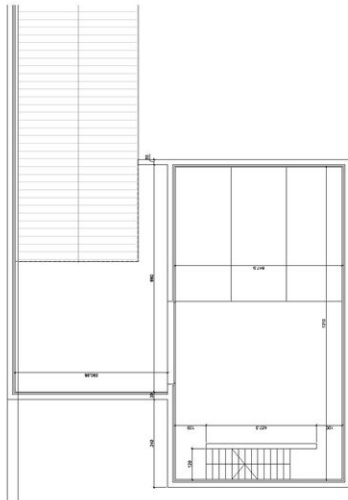
PLANTA SÓTANO. COTAS.

PROYECTO: PROYECTO DE CONSTRUCCIÓN DE UN CENTRO DE INVESTIGACIÓN Y DESARROLLO TECNOLÓGICO EN EL SECTOR DE LA INGENIERÍA Y LA CIENCIA. LOCALIDAD: BARRIO DE LA VILLA, PARRAL DE LA SIERRA, CANTÓN DE LA SIERRA, PROVINCIA DE LOS RÍOS. FECHA: 15/03/2018. AUTORA: PROYECTOS ARQUITECTONICOS Y URBANISTICOS. P. 30