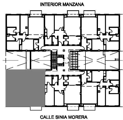
PLANTA 1 a , 2 a , 3 a PUERTA 1